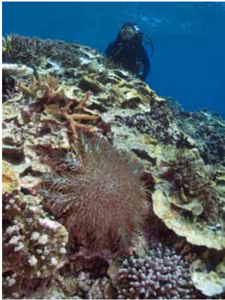
Duiker met doornenkroon