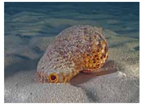
Triton, Lagun, Curacao