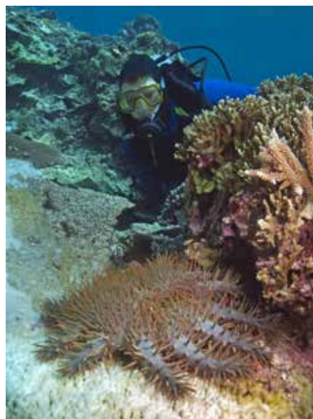
Duiker met doornenkroon

Vroeger, tijdens de jaren tachtig en negentig van de vorige eeuw, is verteld dat de door de doornenkroon veroorzaakte vernieling van het rif, de schuld was van de mens. Door het verzamelen van de tritonschelp, de enige natuurlijke vijand van de zeester, zouden er teveel doornenkronen komen. Of het verhaal klopt? Feit is wel dat ook op de plekken waar geen tritonschelpen worden verzameld doornenkroonplagen voorkomen. En, de tritonschelp moet ook zeker andere zeesterren eten. Neem Curaçao, waar op enkele (verschillende) plaatsen de schelp ook kan worden gevonden. En doornenkroon komen daar op het Benedenwindse eiland helemaal (nog?) niet voor.