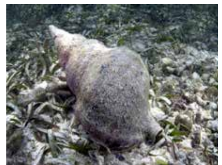
Tritonschelp, Curacao, Oostpunt