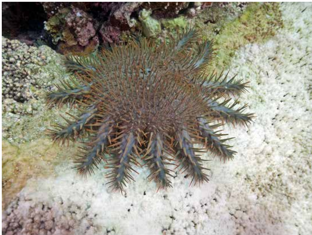
doornenkroon op afgevreten koraal. Het herstel zal jaren vergen.