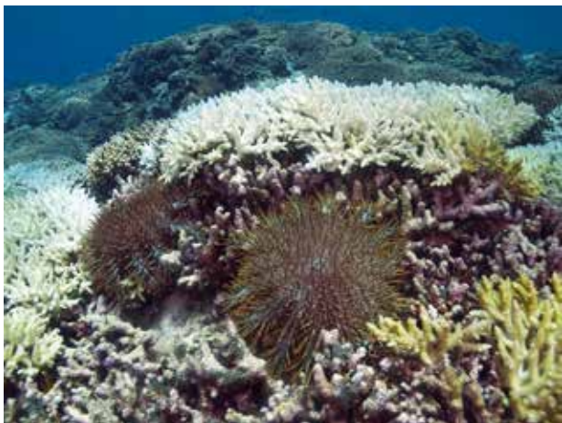
Doornenkroon op het rif