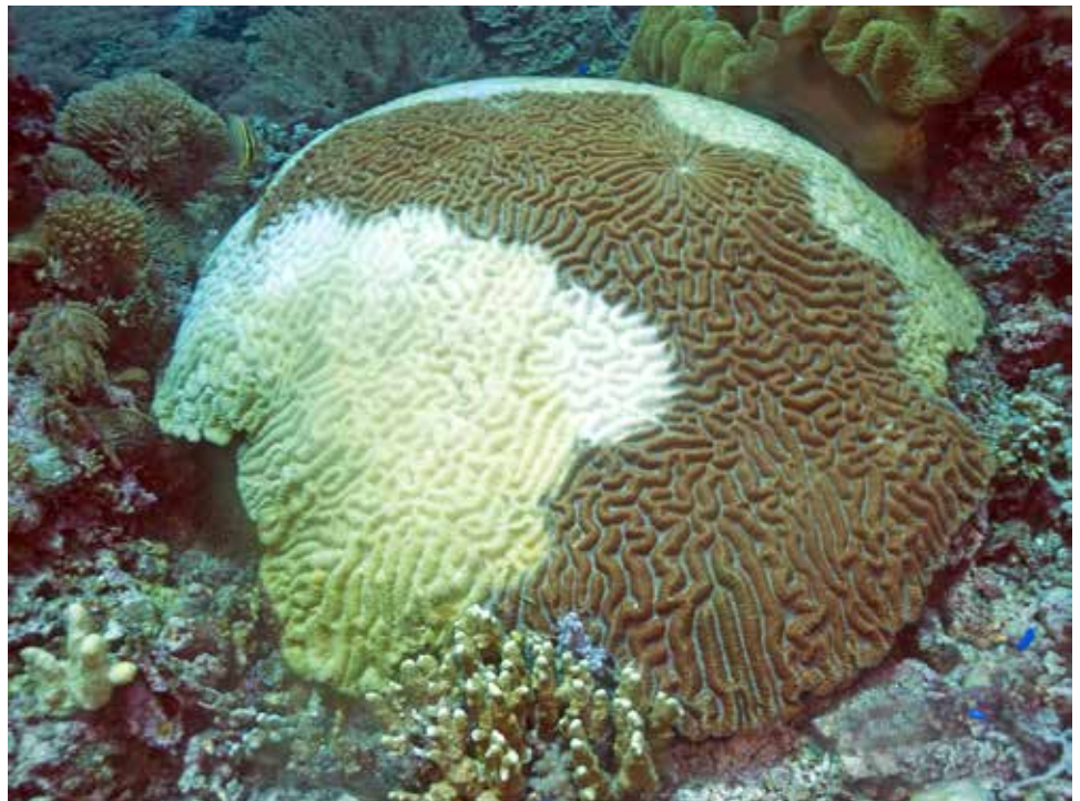
Hersenkoraal na het bezoek van een doornenkroon

De boot is onderweg naar Coron. Hoe het eiland bij het door de doornenkronen aangetaste koraal heet? Niemand die het weet. Het is een stipje in de grote Suluzee. Er is net vier dagen gedoken op het het