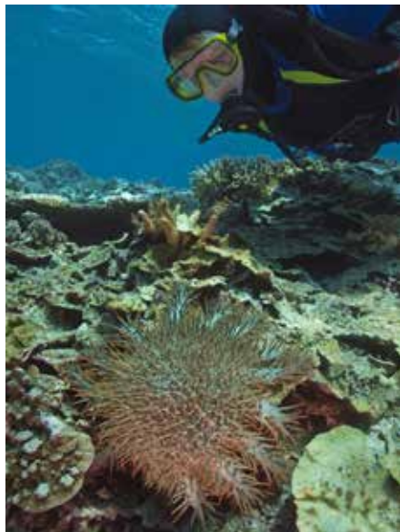
Duiker met doornenkroon