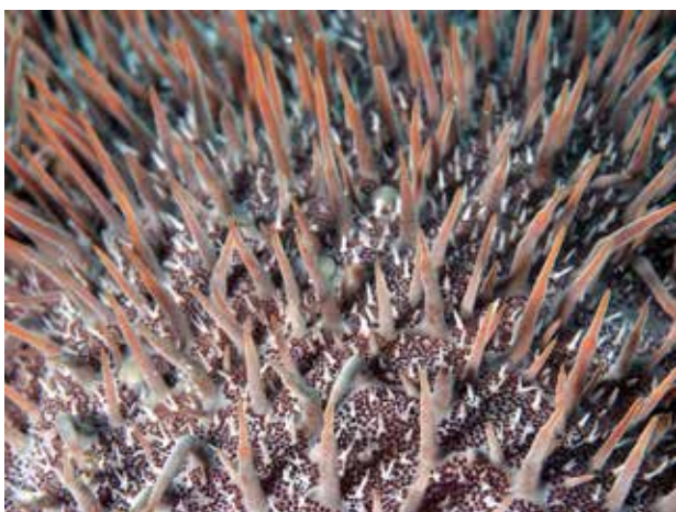
Doornenkroonstekels Komodo macro