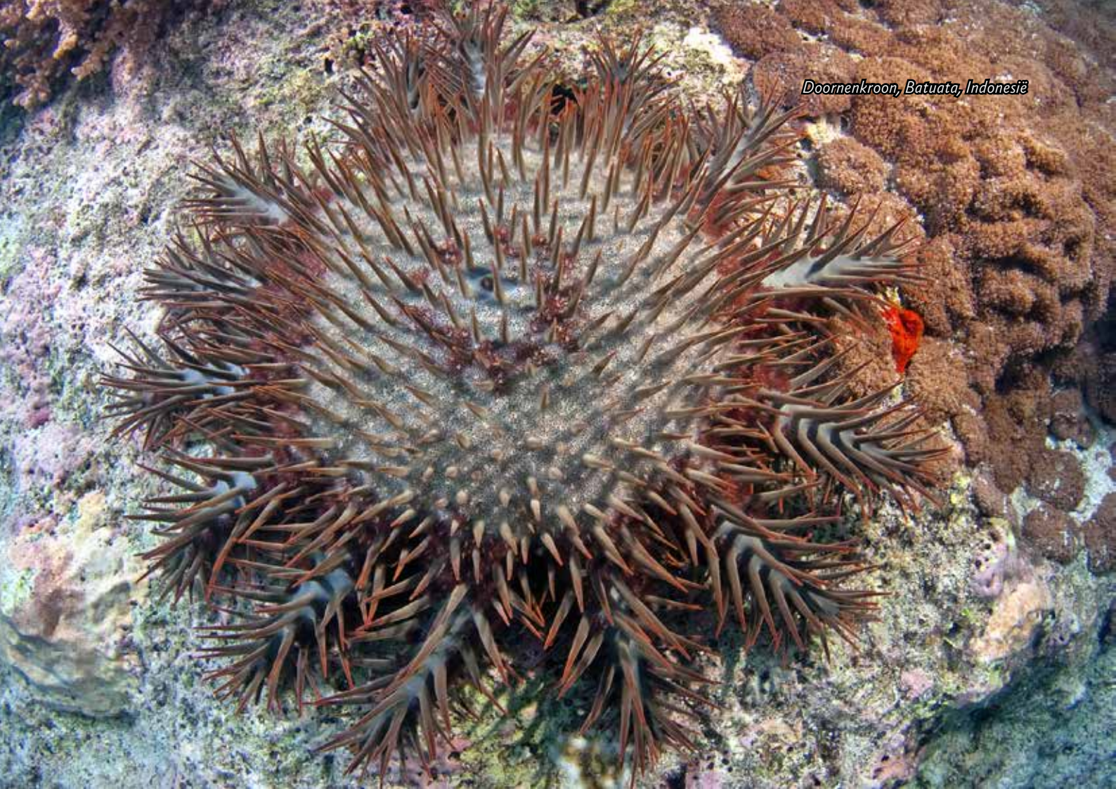
Doornenkroon onder koraal