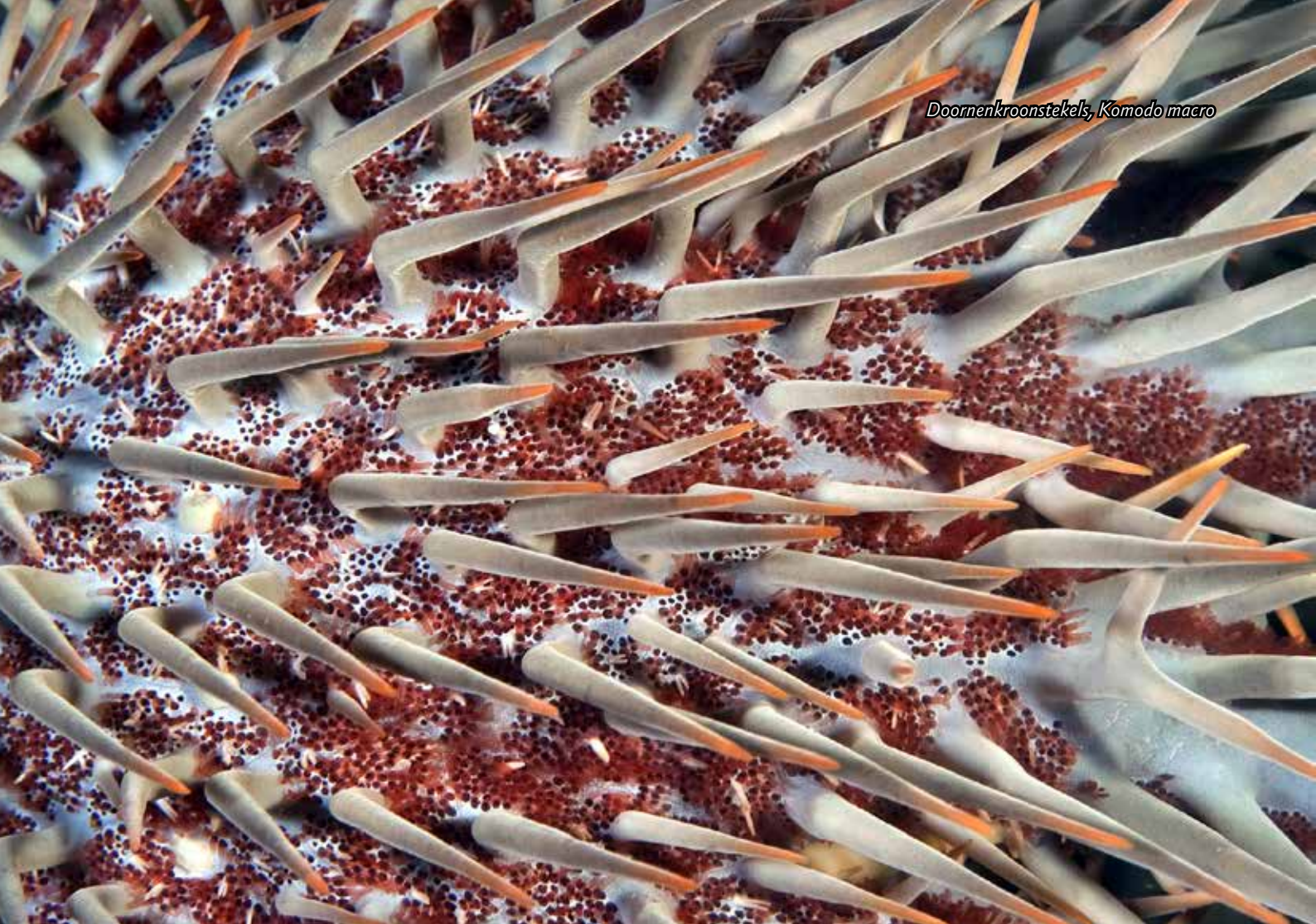
Doornenkroonstekels, Komodo macro