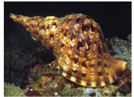
Triton, Sabang Beach, Filippijnen