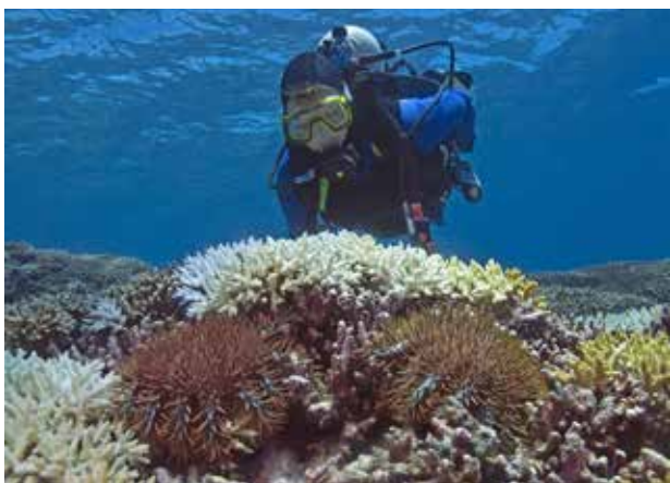
Duiker met doornenkroon

‘Normaal,’ zo legt ze uit, ‘komt er een plaag van de doornenkronen op en dan verdwijnen ze na een maand of zes. Dit keer bleven ze drie jaar!’