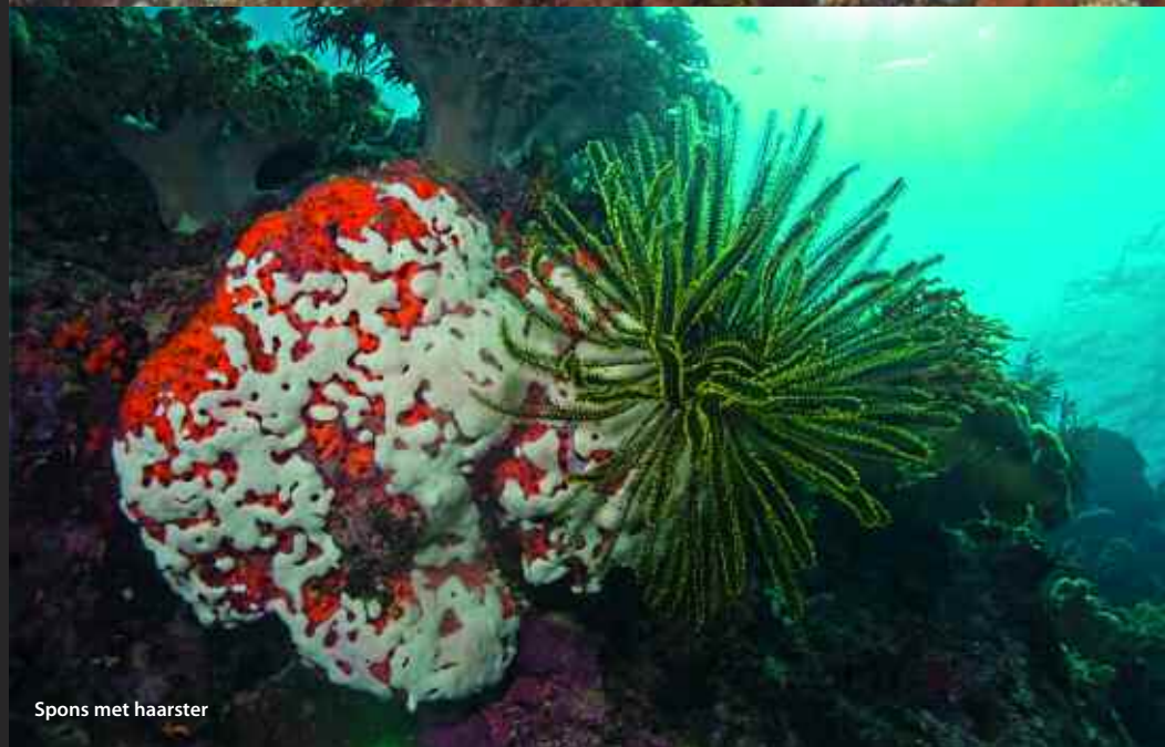
Spons met haarster

middag of avond, om de volgende morgen op de bestemming te arriveren, een afstand van zo'n 150 km.