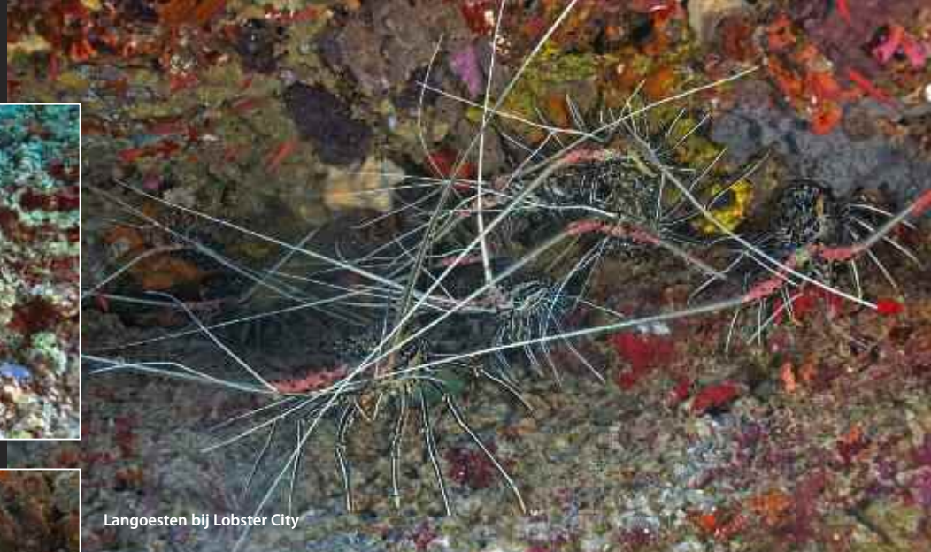
Langoesten bij Lobster City