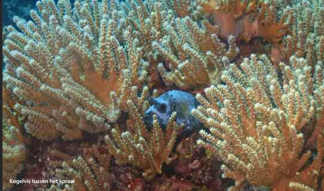
Kogelvis tussen het koraal

DONATIE Om er te komen moet er een uurtje worden gevlogen vanaf Manila naar Puerto Princesa, daarna is het 5 minuten naar de Puerto Princesa-pier in de haven. De meeste cruiseboten vertrekken aan het eind van de