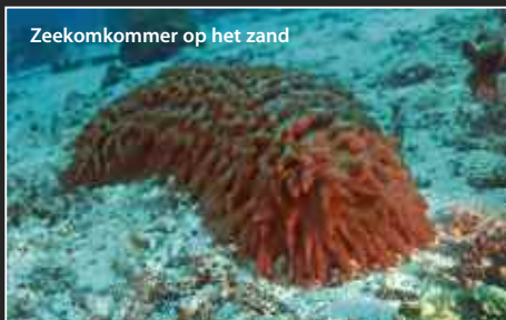
Zeekommer op het zand