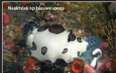
Naaktslak op blauwe spons