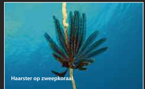
Haarster op zweepkoraal

En om de opsomming niet al te uitputtend te maken: het grote anker van de Delsan. Dat ligt op 3 meter en is zo groot dat er zelfs met de fish-eye lens achteruit moest worden gegaan om het er helemaal op te krijgen. Het schip is helemaal vergaan, alleen het anker ligt er nog.