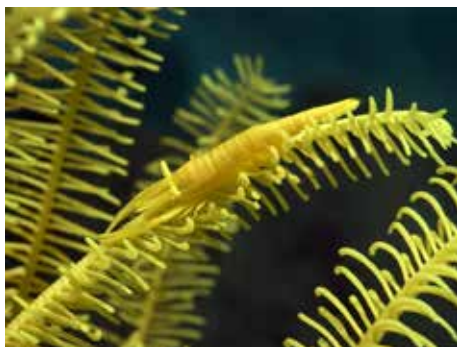
gelehaarster met garnaal Sabang

Het lichaam van de zeelelies bestaat voor het grootste deel uit kalk.