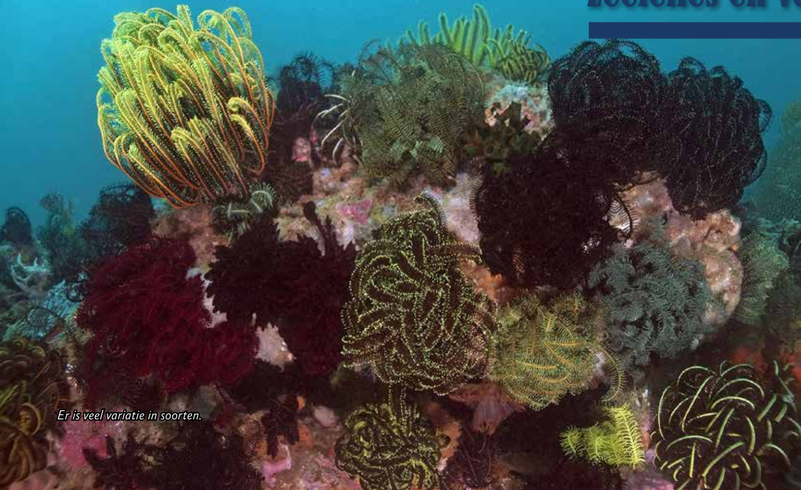
Er is veel variatie in soorten.