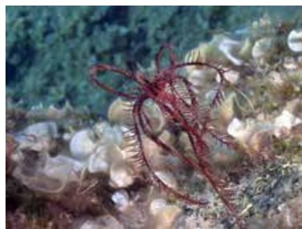
wandelende haarster Kroatie

Ze hebben een lange stevige steel (pedunculum), waarmee ze permanent door middel van een hechtplaat – het laatste steellid – aan het substraat zijn vastgehecht. Ze kunnen echter wel op de steel heen en weer bewegen en zo een cirkel beschrijven. In de oertijd kon de lengte van de steel vele meters bedragen. De splittingsen van de armen hebben verharde stekels (pinnula), die zijn bezet met trilharen. Deze haartjes wuiven de op de armen opgevangen voedseldeeltjes naar een groef (ambulacraalgroef) op het midden van de arm. Daar wordt het voedsel in slijm verpakt en door trilharen naar de mond gevoerd. Deze bevindt zich aan de bovenkant van het lichaam, met op een schoorsteenachtige zuil naast de mondschild de anus. Door deze verhoogde positie kunnen de uitwerpselen niet in de mond komen.