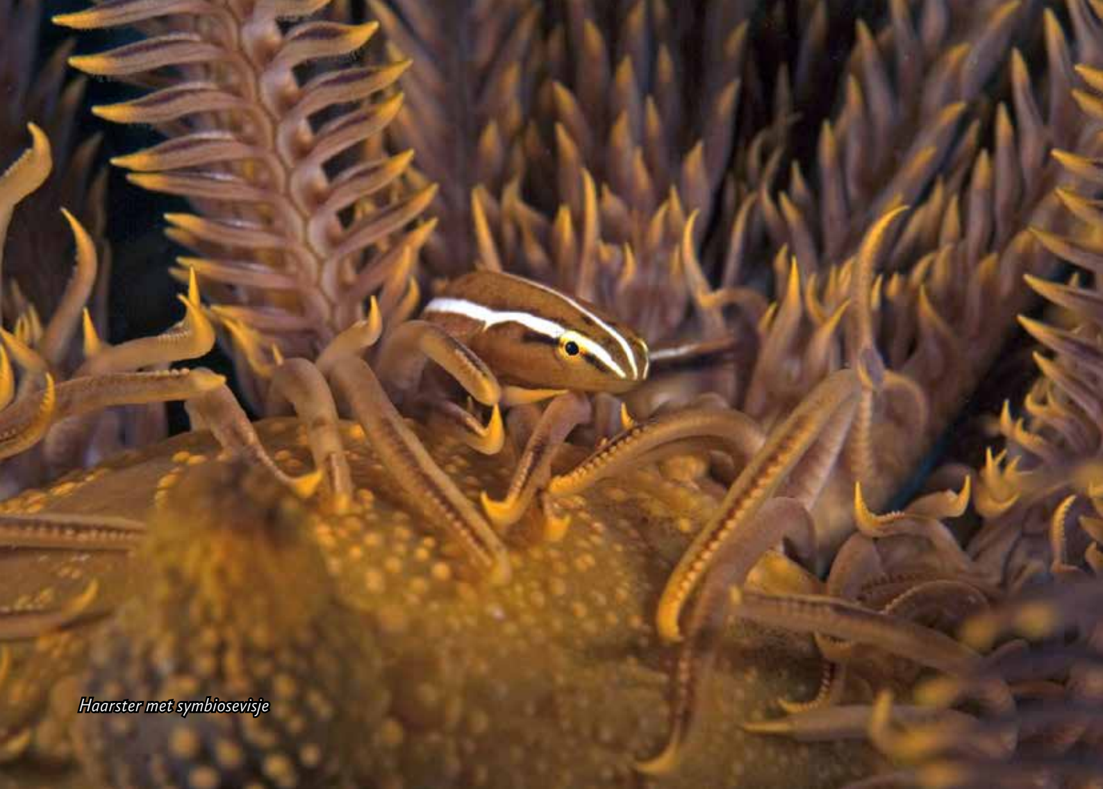
Haarster met symbiosevisje