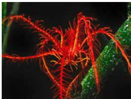
rodehaarster Marseille. Als het donker wordt kruipen ze tevoorschijn

Deze en nog een aantal andere uitdrukkingen hebben als centraal element het woord 'pluim': een (grote) veer of verenbos. Dit woord is afkomstig van het Latijnse "pluma" (veer, dons) en "plumam" (vliegen). Veren werden vroeger als versiering op hoeden en helmen gestoken, waardoor de drager opviel en zijn belangrijkheid toenam. Op oude prenten en schilderijen zien we vaak adellijke personen trots poseren in een glimmend harnas, met op de helm een enorme pluim. Ook onder water zien we grote pluimen, maar die hebben niets te maken met veren of dons.