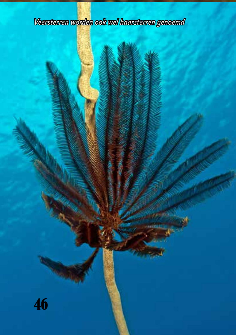
Veersterren worden ook wel haarsterren genoemd