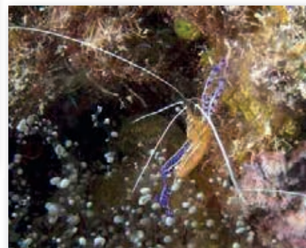
Periclimenes pedersonigarnaal Curaçao

Nog een slak, die zijn gastheer opeet, is de longicirruslak. Op de foto op deze pagina's bovenop het lederkoraal, waarvan hij zit te knabbelen. De draadslak is alleen maar op dit lederkoraal te vinden, hij eet niets anders. Waarschijnlijk heeft het te maken met de zoöxantellen in het lederkoraal. Een heel bijzondere vondst van de gids op Lembeh. Hij is overigens best wel groot, zo'n 10 a 12 centimeter en een duidelijk voorbeeld van een parasiet.