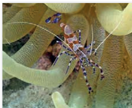
Periclimenes yucatanicus, symbiosegarnaal

Hij is heel schuw en het duurde dan ook heel lang voordat een goede foto kon worden genomen. Normaal gesproken niet zo geduldig, maar nu met een opdracht, een 'mission', moest het wel. De volgende search was op het huisrif