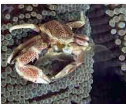
Neopetrolisthes maculatus , porcelijnkrab

Zo nu en dan is een hele kale plek rondom de garnaaltes te zien. Wie al eens door zee-egels is gestoken kent de pijn en heeft dus zeker geen medelijden met een zee-egel?