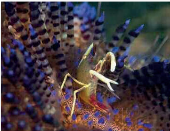
Allopontonia iaini , Commensal shrimp, garnaal op vuurzee-egel Anilao