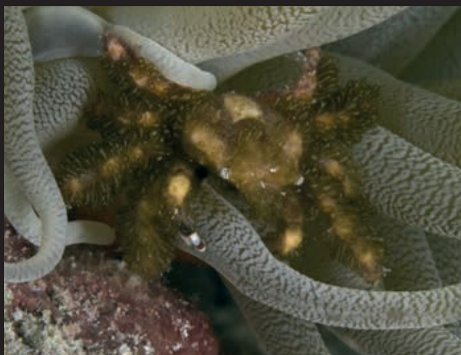
Mithrax cinctimanus, banded clingin crab Curaçao

De Coleman garnalen ( Periclimenes colemani ) zijn ook alleen maar op de vuurzee-egel te vinden. Ze eten de zachte tentakels van de zee-egel, die vindt dat zeker niet fijn!