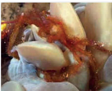
Achaeus Japonicus , orang oetang krab in koraal Wakatobi

Een hele nieuwe ontdekking op de vuurzee-egel is een klein garnaalte.