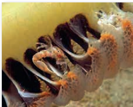
Thor amboinensis op Curaçao

Symbiose is het samenleven van verschillende diersoorten. Dit samenwonen zou voor beide dieren voordeel moeten geven. Zodra er maar voor één dier voordeel is te vinden heet het comensalisme en als een dier nadeel heeft, dan wordt het parasitisme genoemd. Voor veel duikers en fotografen is het een fascinerend onderwerp. Er zijn veel voorbeelden te noemen van symbiose naast dus het bekende samenwonen van anemoonvissen in de anemoon.