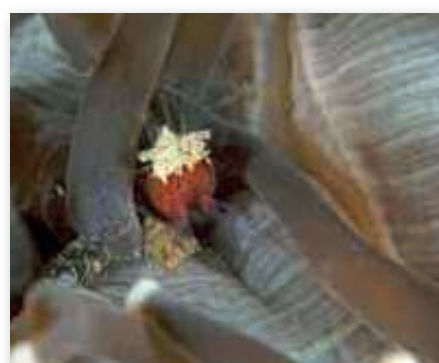
Periclimenes kororensis , Anilaokrab in koraal

egel geen kwaad. Ook schuilen er vaak visjes in de zee-egel. Zo voelen de kardinaalvisjes zich veilig tussen de puntige stekels. In het aquarium van de Burgers Zoo is verteld dat bangai kardinaalvisjes muilbroeders zijn. Bij gevaar nemen ze de kleine visjes op in hun bek, maar zodra de visjes groter worden, worden ze uitgespuugd tussen de stekels van de zee-egels. Op Lembeh en Bali is ook te zien dat ze graag tussen de zee-egels