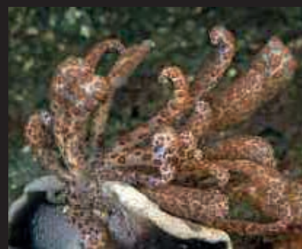
Phylloidesmium longicirrum slak op leder koraal Lembeh

Een andere vorm van symbiose is waarbij een van de partners voordeel heeft, maar de andere nadeel ondervindt. Dit heet eigenlijk parasitisme, zoals de witte slak ( Luetzenia asthenosoma ) op de vuurzee-egel ( Asthenosoma varium ).