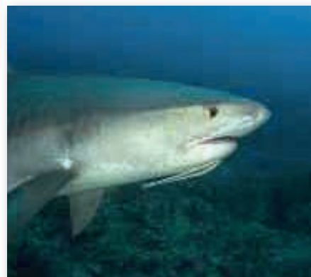
Tijgerhaai met remora

De spitssnuitkoraalklimmer zit altijd in de grote gorgoon. Misschien dat zijn bijzondere tekening van strepen en ruiten juist wegvalt in de wirwar van gorgoon-takken? Op deze pagina's een foto van