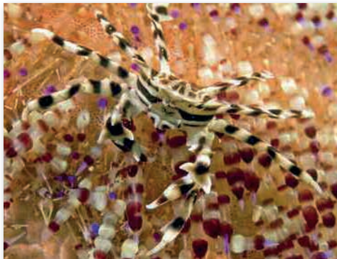
Zebrida adamsii zebrakrab Sabang