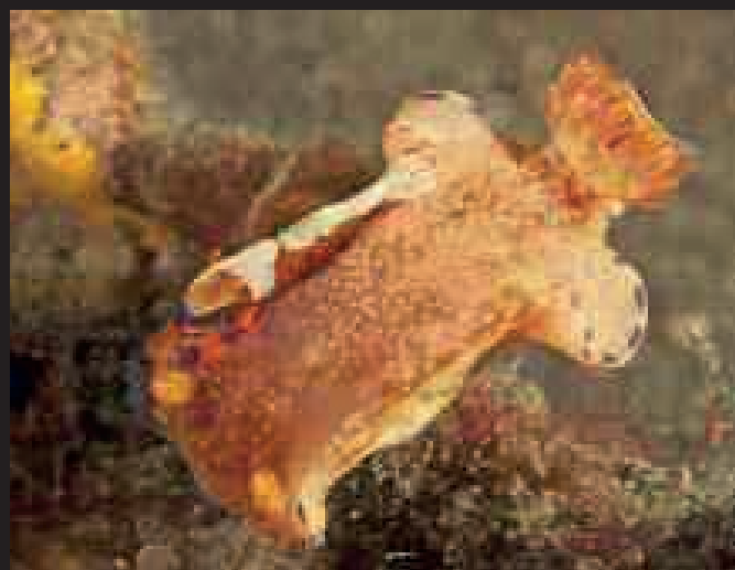
Periclimenes imperator, garnaal op Ceratosoma trilobatumslak Lembeh