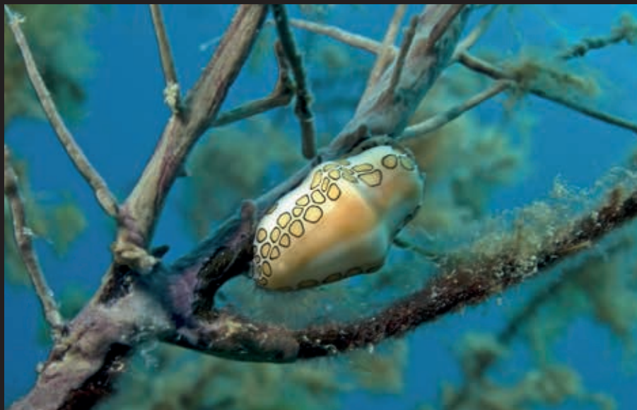
Cyphoma gibbosum, flamengotong Curaçao