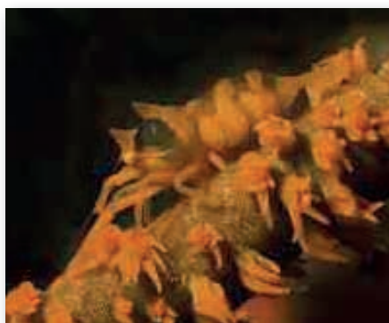
Dasycaris zanzibarica , garnaal op zweep koraal Lembeh

Nog een diertje op deze zee-egel is de zebra krab ( Zebrida adamsii ). Ze zijn vaak met z'n tweeën en ze doen de zee-