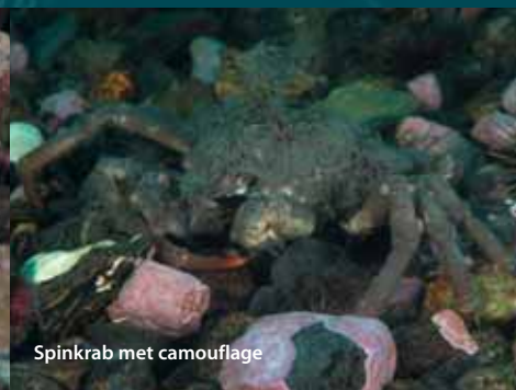
Spinkrab met camouflage