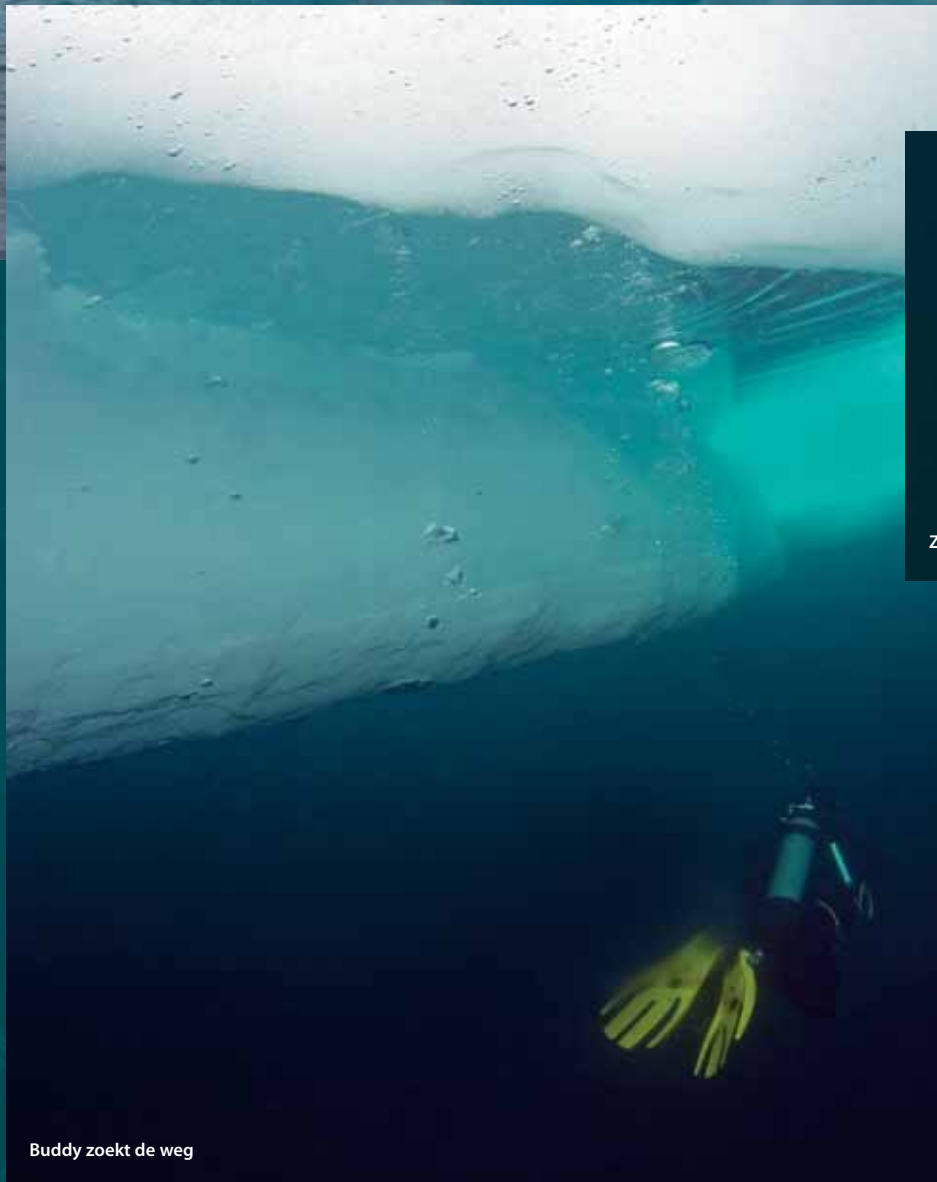
Buddy zoekt de weg