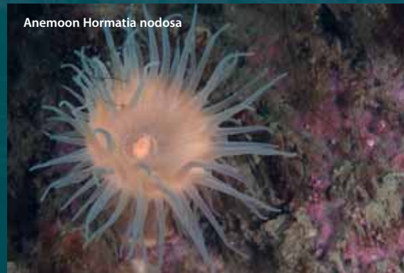
Anemoon Hormatia nodosa

Helaas: het viel best wel tegen. Eerst lang aan het zoeken met de Zodiacs naar een geschikt plek om van de kant het water in te gaan.