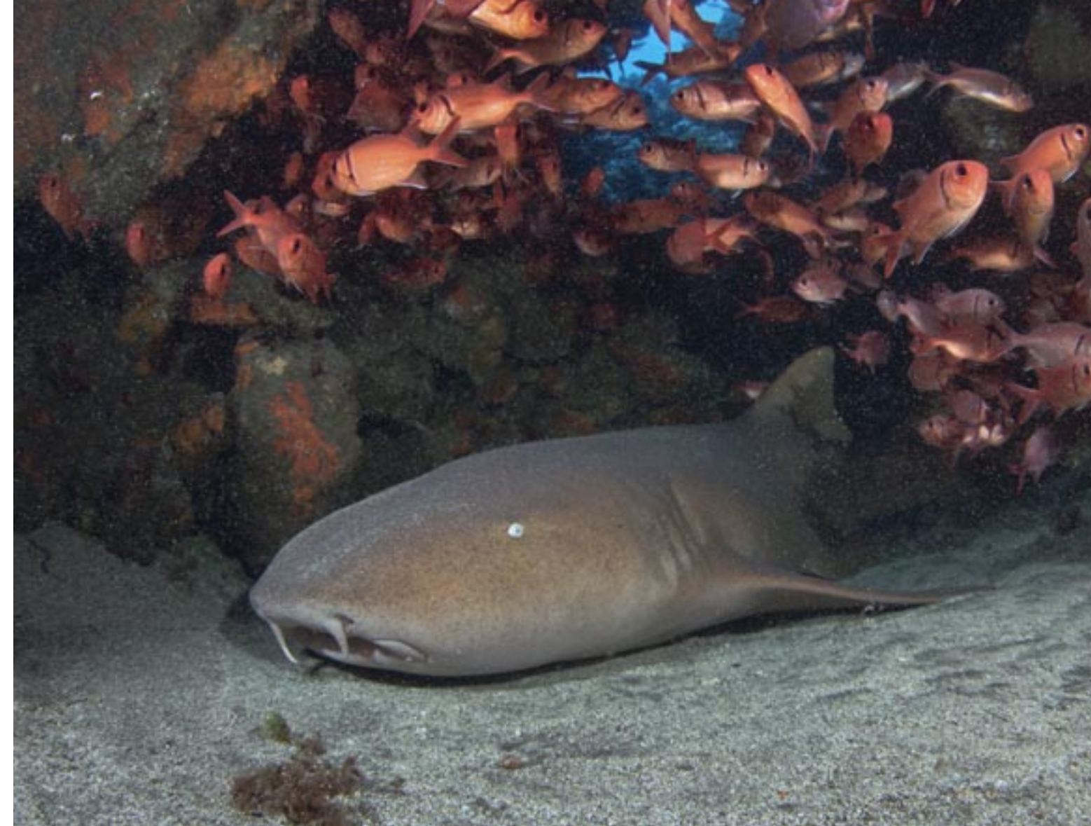
linksboven: Een school doktersvissen gaat opzij. links: Kussenzeester, Oreaster clavatus. Linksonder: Soldatenvissen bewaken het koraal. Hierboven: Laatste geheim: een dikke dame.