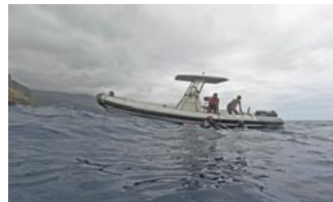
Dive-Tribe São Antao beschikt over een grote RIB. Authentieke huisjes in het noordoosten van het eiland.

Antonio had al verteld dat de eilanden vroeger groen waren en met weelderige planten en bossen waren bedekt. Door de houtkap voor houtvuur om op te koken, reparatie van boten en de landbouw zijn er veel bomen verdwenen. En samen met de bomen ook de vruchtbare grond. Ook al regent het hier weinig, de dunne bovenlaag van vruchtbare grond is op veel plaatsen in de zee gespoeld. Maar de noordoostkant van São Antao ligt precies op de wind. De passaat brengt hier een regelmatige