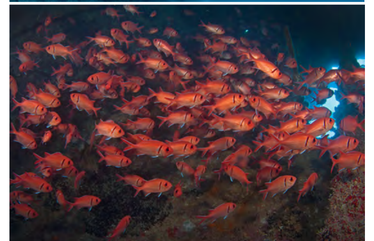
Van boven naar beneden: Achtergebleven netten blijven vissen vangen. Duikers van Ghost Fishing ruimen op. Vangstmethoden werden steeds geavanceerder en zo raakte de balans verstoord.