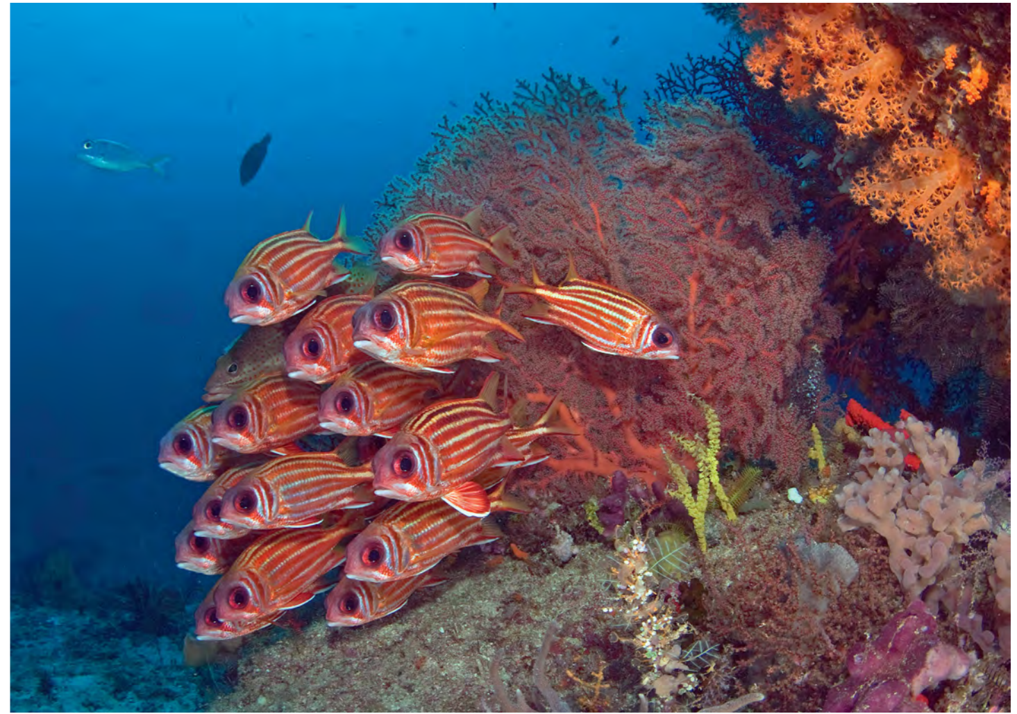
Schooltje eekhoornvissen.

bijvangst is. Voorwaarde is wel dat er nog voldoende dieren over zijn om herstel mogelijk te maken. De kabeljauw begint in de Noordzee bijvoorbeeld terug te komen van een historisch dieptepunt in