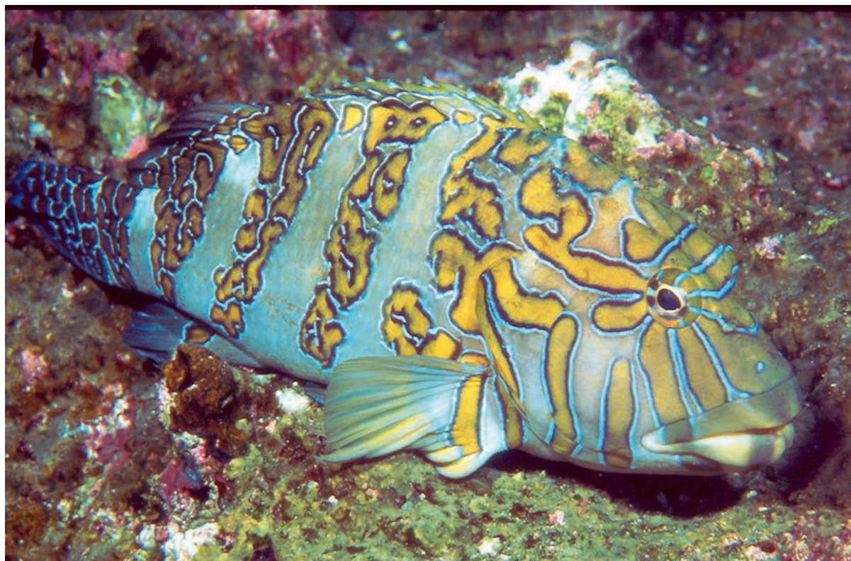
Reuze koraalklimmer ( Cirrhites rivulatus ).