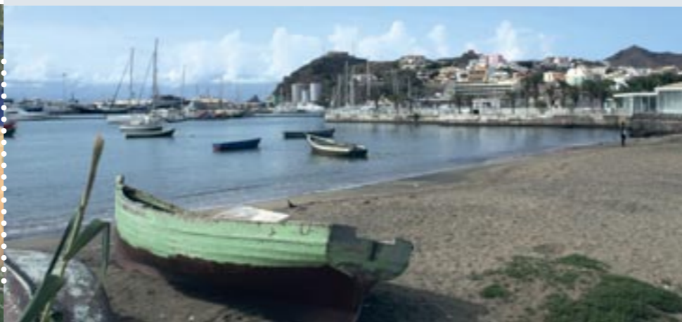
De haven van Mindelo.