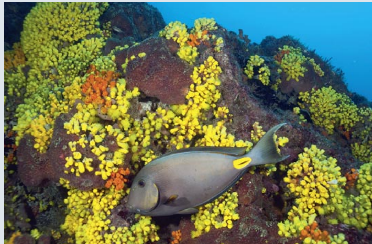
Foto boven: Doktersvis tegen een achtergrond van koraal. Onder links: Het wrak van de São Ma Cario ligt slechts veertien meter diep. Midden rechts: Bidsprinkhaankreeft (spietser). Onder rechts: Overal vind je kleine murenen.