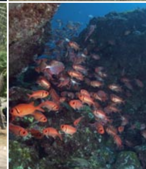
Foto linksboven: Op São Vicente is alles nog kleinschalig en pittoresk. Linksonder: Dive-Tribe. Foto rechtsboven: Deze kogelvis bleef poseren. Foto rechtsonder: Soldatenvissen in hun effectieve, felrode schutkleur.