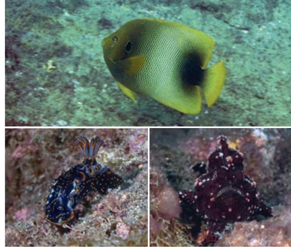
Foto boven: De Afrikaanse keizersvis, Guinean Angelfish.. Onder links: Naaktslak: Hypselodorispicta. Onder midden: Senegalese hengelaarsvis. Rechts: We werden gepakt door de stroming en vielen middenin enorme scholen vis.