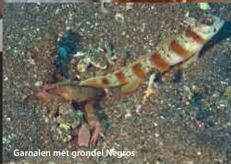
Garnalen met grondel Negros