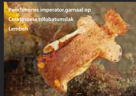
Periclimenes imperator, garnaal op Ceratosoma trilobatumslak Lembeh

bovenop het lederkoraal, waarvan hij zit te knabbelen. De draadslak is alleen maar op dit lederkoraal te vinden, hij eet niets anders. Waarschijnlijk heeft het te maken met de zoöxantellen in het lederkoraal. Een heel bijzondere vondst van de gids op Lembeh. Hij is ove-