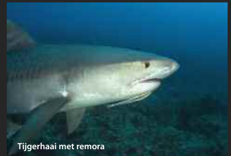
Tijgerhaai met remora