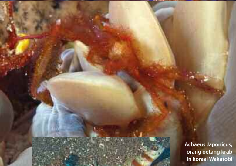
Achaeus Japonicus, orang oetang krab in koraal Wakatobi