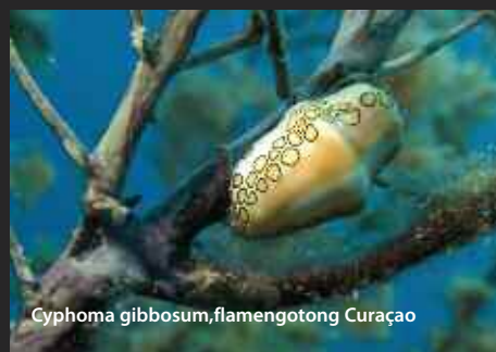
Cyphoma gibbosum, flamengotong Curaçao