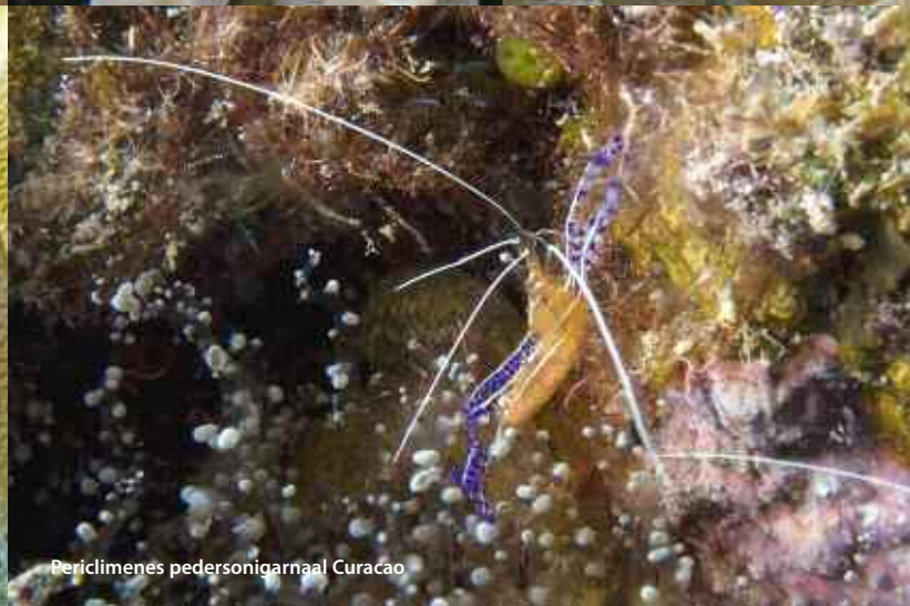
Periclimenes pedersonigarnaal Curaçao

poetsgarnaal, de Periclimens pedersoni , wel heel mooi, maar niet wat werd gezocht. De speurtocht naar de squatshrimp ( Thor amboinensis ) begon in de baai van Lagun. Het is daar heerlijk rustig en er zijn veel anemonen.