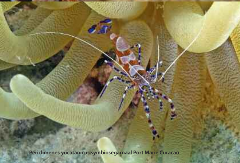
Periclimenes yucatanicus, symbiosegarnaal Port Marie Curacao