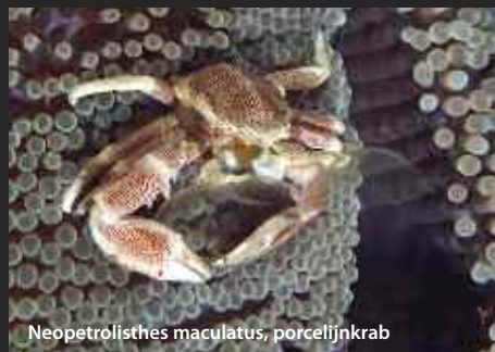
Neopetrolisthes maculatus, porcelijnkrab