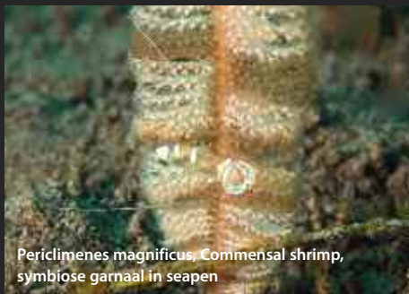
Periclimenes magnificus, Commensal shrimp, symbiose garnaal in seapen

rigens best wel groot, zo'n 10 a 12 centimeter en een duidelijk voorbeeld van een parasiet.