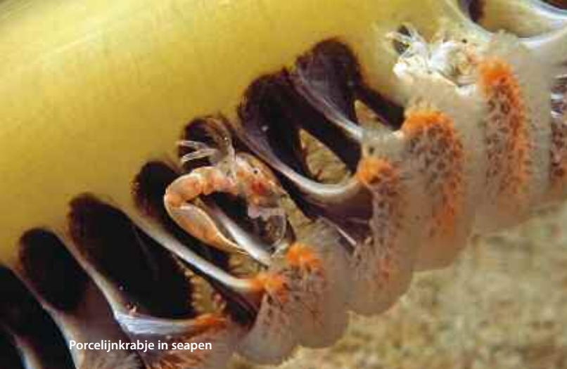
Porcelijnkrabje in seapen