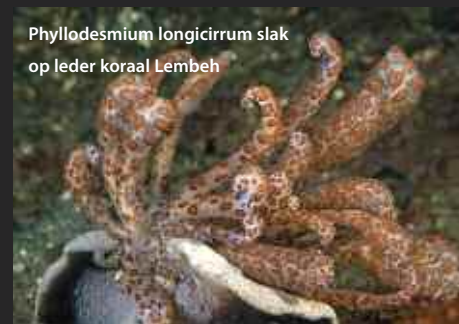
Phyllodesmium longicirrum slak op leder koraal Lembeh