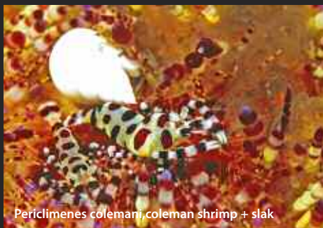
Periclimenes colemani, coleman shrimp + slak

HAARSTERREN Haarsterren zijn ook gastheer van allerlei crustacea, zoals garnaaltjes en krabbetjes, die voelen zich veilig tussen de plakkerige tentakels. Het huisrif van Bahura is een waar eldorado van kleine beestjes! Op het zweepkoraal zitten vaak kleine visjes en garnaaltjes. De iets grotere symbiosegarnaal ( periclimenes magnificus ) is wel 2,5 cm groot en