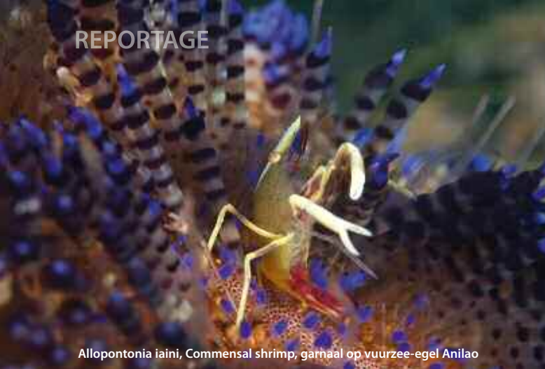
Alloponotonia iaini, Commensal shrimp, garnaal op vuurzee-egel Anilao