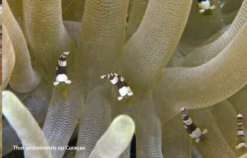
Thor amboinensis op Curaçao