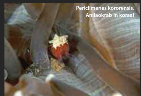
Periclimenes kororensis, Anilaokrab in koraal