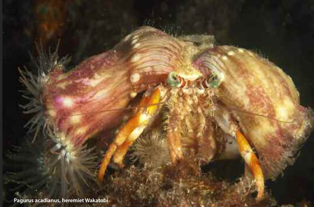
Pagurus acadianus, heremiet Wakatobi

ONTDEKKING Een hele nieuwe ontdekking op de vuurzee-egel is een klein garnaaltje. Eerst werd gedacht dat het een krabje was. Er ontstond zelfs een discussie om het nieuwe diertje. Gelukkig had het duikresort in Anilao het boek van Debelius over Crustacea. Daar staat duidelijk op pagina 176 dat het een garnaal is, met de