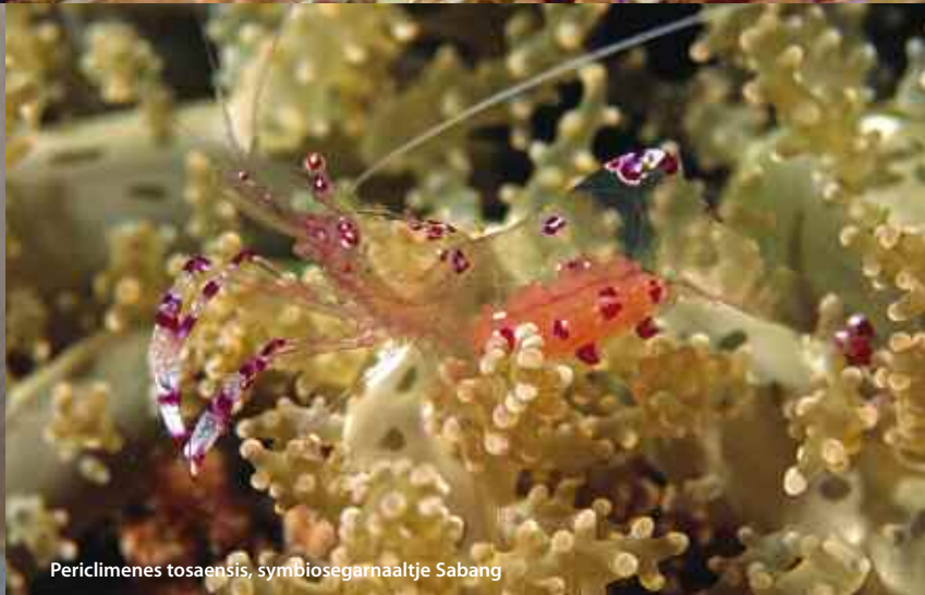
Periclimenes tosaensis, symbiosegarnaaltje Sabang