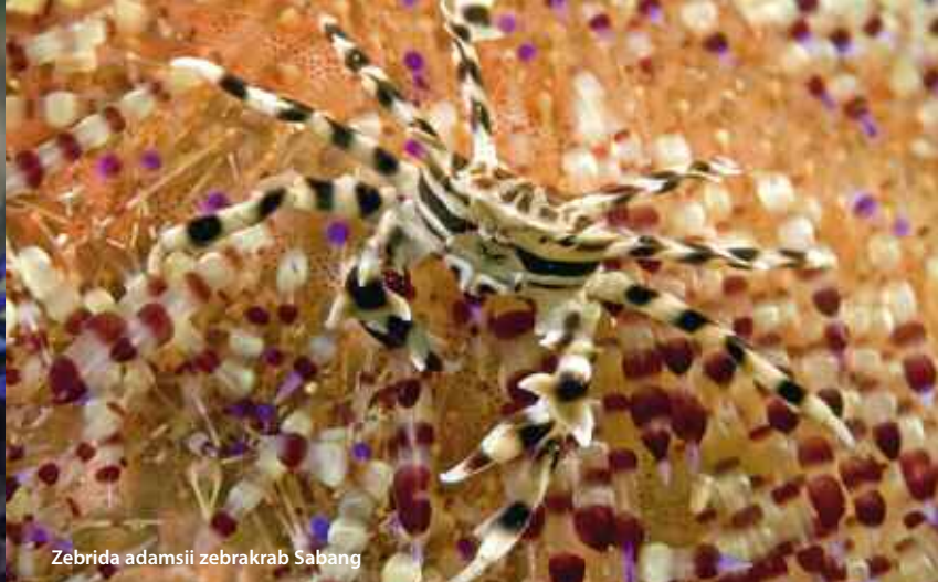
Zebrida adamsii zebrakrab Sabang