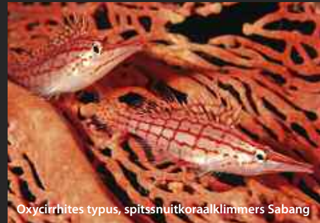
Oxycirrhites typus, spitsnuitkoraalklimmers Sabang