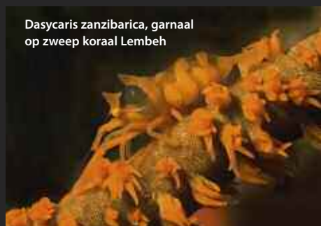
Dasycaris zanzibarica, garnaal op zweep koraal Lembah

KARWEI Tot slot: tijdens een reis rondom Cebu is op Pescador eiland een heremietkreeft gevonden, die zijn kwetsbare achterlijf bij voorkeur verschuilt in een lege schelp. Soms zet hij daar ook nog anemonen op. De anemonen kunnen zo groot worden, dat de heremiet er een heel karwei aan heeft om dit gewicht mee te sjouwen. De anemonen zijn voor bescherming, want ze zijn giftig voor andere dieren. De anemonen hebben het ook naar hun zin, ze worden gratis naar voedsel gebracht. Deze symbiose is zo succesvol, dat ze bij een eventuele verhuizing worden losgepukt en overgebracht naar het nieuwe onderkomen! Hieruit blijkt dat anemonen zowel gast als gastheer kunnen zijn. Het perfecte symbiosedier dus.