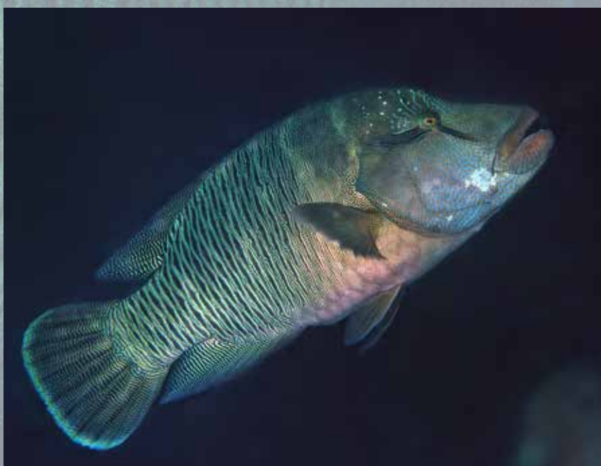
Alle Napoleon lipvissen worden als vrouwtje geboren.

We zien het ook veel in de plantenwereld en bij lagere dieren zoals regenwormen, slakken, garnalen en schelpdieren zoals oesters. Soms bepaalt de omgevingstemperatuur of de dieren zich vrouwelijk of mannelijk zullen ontwikkelen. Hoewel bij veel diersoorten zowel mannelijke als vrouwelijke geslachtsorganen aanwezig zijn, vindt toch een paring plaats om zelfbevruchting en daarmee inteelt te voorkomen. Een aantal vissoorten, zoals lipvissen en vlaggenbaarsjes, is in staat te veranderen van geslacht. Soms openbaart deze verandering zich als een mannetje (testes) in een vrouwtje (eierstokken) verandert. Dit wordt ook wel protandrische geslachtsverandering (protandrie) genoemd. Veel vaker veranderen