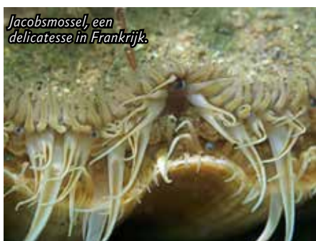
Jacobsmossel, een delicatessie in Frankrijk.

Bretagne heeft op mij een magische aantrekkingskracht. Het is niet alleen het afwisselende landschap, de altijd aanwezige zee en het mooie duiken! Bretagne heeft iets bijzonders, iets wat ik moeilijk kan uitleggen. De steile rotsen en indrukwekkende kliffen worden afgewisseld door romantische baaien met prachtige zandstranden. Voorbeelden zijn te vinden in het dorp Camaret sur Mer. Dat ligt aan het uiteinde van het schiereiland Presqu'île de Crozon. Overal staan menhirs, grote stenen waarvan de oorsprong en bedoeling nog steeds onduidelijk is. In Camaret staat de duikschool Club Leo la Grange. Het is een soort jeugdherberg waar je allerlei watersporten kunt doen, waaronder duiken. Nu is het duiken op open zee niet voor iedereen. In Bretagne is het vaak hetzelfde weer als in Nederland, alleen een dag eerder. Het hoeft maar ergens te waaien en er ontstaat al een enorme deining. En met het beroemde getijdenverschil van zo'n zes meter kan het aardig stromen.