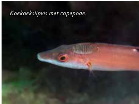
Koekoekslipvis met copepode.

Ik had me voorgenomen om deze keer de blauwe oogjes te fotograferen. De hele mossel had ik al, maar nu het toch een soort macro-reis begint te worden, kan ik net zo goed de oogjes doen. Als ik klaar ben duik ik verder over grote gele sponzen, zee-egels, grondels (zoals de roodbekgrondel Gobius cruentatus ), dodemansduim, kleine visjes en Noordzee krabben. Ook die zitten samen, yes, love is in the air!