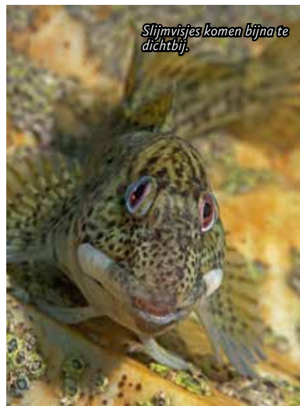
Slijmvisjes komen bijna te dichtbij.

de rechterkant te water. Daar ligt een oude pier waarvan alleen de pilaren nog overeind staan. We hebben vaak daar ondiep gescharreld, wat we heel leuk vonden. Als het niet te hard stroomt kun je ook naar de eerste pilaar zwemmen. Daar vind je een uitbundig onderwaterleven.