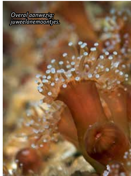
Overal aanwezig: juweelanemoontjes.

heeft drie van zulke plekken! Zo maken we van iedere vultocht een prachtig uitstapje.