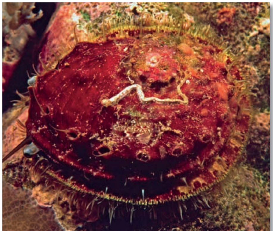
De oorschelp heet ook wel abalone, (foto: Marion Haarsma).

Mikimoto onafhankelijk van elkaar een methode om parels te kweken. Europese handelaren vermoedden oplichterij en begonnen een rechtszaak. De Japanner Kochichi Mikimoto won deze zaak, waardoor hij in de westerse wereld bekend werd als de man die een methode had ontdekt om parels te kweken. De door Mikimoto toegepaste methode om parels te kweken (cultiveren, vandaar de naam cultivé ) bestaat uit het inbrengen van een bolletje (kern) van schelp of parelmoer met een stukje mantel van een donor-oester in het lichaam van een oester. De oester zet dan om deze kern heen laagjes parelmoer af. Na ongeveer twee jaar is dit proces voltooid en kan de parel worden verwijderd. Deze moet echter wel aan een aantal eisen voldoen en heeft bepaalde eigenschappen. Belangrijk voor de prijs van de parel is de glans of 'luster'. Hoe dikker de parelmoerlaag (huid), des te dieper de glans en het vermogen om kleur te reflecteren. Ook de kleur is belangrijk voor de prijs, afhankelijk van de populariteit van het moment en de bijzonderheid van de kleur.