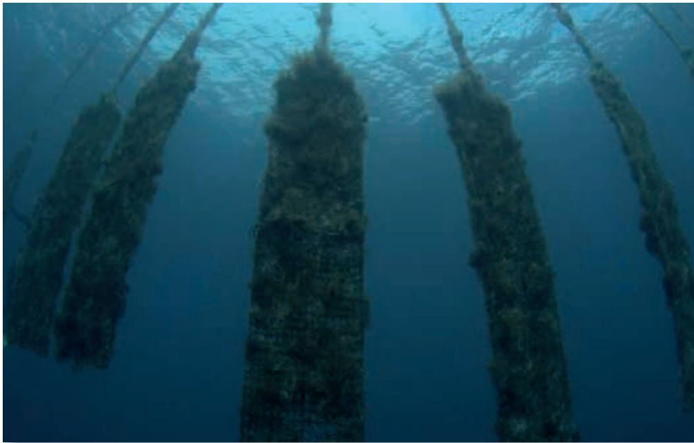
Parelcultuur in tropisch water.

Dit geldt ook voor de vorm. De duurste parels zijn perfect rond van vorm of druppelvormig. Verder speelt de oppervlakte een belangrijke rol: de parel kan gaatjes, gleufjes, deukjes of bobbels bevatten. Hierdoor wordt de uitstraling van het luster aangetast en daar is het juist om begonnen. Ten slotte is er nog de grootte: hoe groter de parel, hoe duurder.