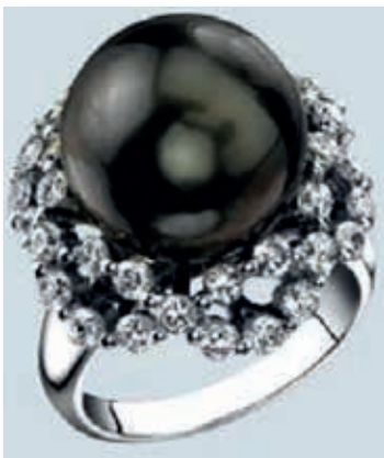
Zwarte parels komen voor in de oester Pinctada margarita .

Ten slotte zijn er ook weekdieren die in het zoete water leven en parels maken. De belangrijkste zijn de driehoeksmossel ( Hyriopsis cumingii ), waarvan de parels divers van kleur zijn, en de oriëntaalse mossel ( Christaria plicata ) die witte parels geeft. Deze mossel kan wel dertig centimeter groot worden en verschillende parels bevatten. Hoewel het duiken naar parels bijna verleden tijd is, zijn er figuurlijk gesproken onder het wateroppervlak genoeg andere 'parels' te vinden. De duiksport is in de afgelopen jaren niet voor niets zo populair geworden. Duikers zijn bevoorrecht en velen genieten van de schitterende dierenwereld in het rijk van Neptunus, waar de 'parels' voor het oprapen liggen!