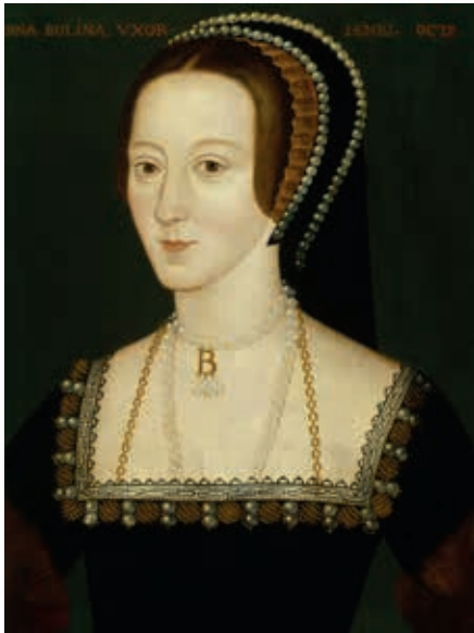
Anna Boleyn had een luisterrijk parelsnoer.

De ama's daalden vaak tot grote diepten af, slechts voorzien van een brillettje, een haak, een mes en een zak voor het opbergen van de abalones (zeeoren). Ze smeerden hun lichaam met vet in tegen de kou. Het beroep