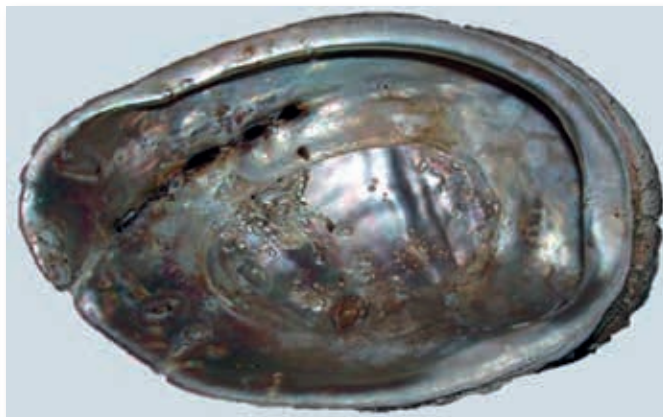
Parelmoer bedekt de binnenzijde van de oorschelp