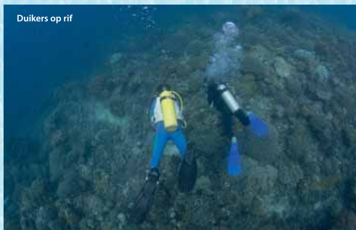
Duikers op rif