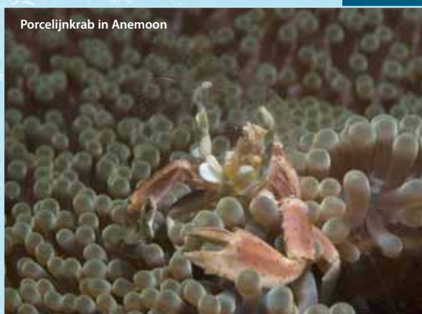
Porcelijnkrab in Anemoon