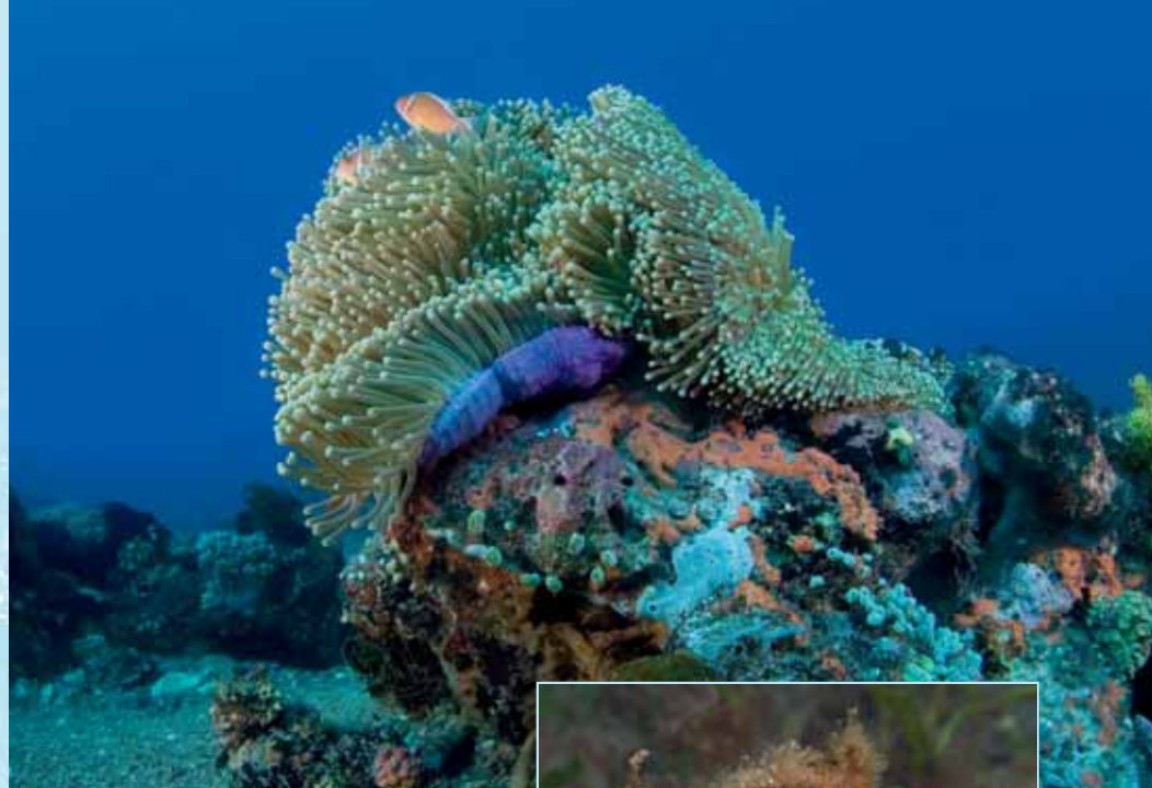
Anemoon bij Apo-eiland

APO-EILAND En naast de Ducomipier is er dus ook het bekende Apo-eiland. Vanaf het re-