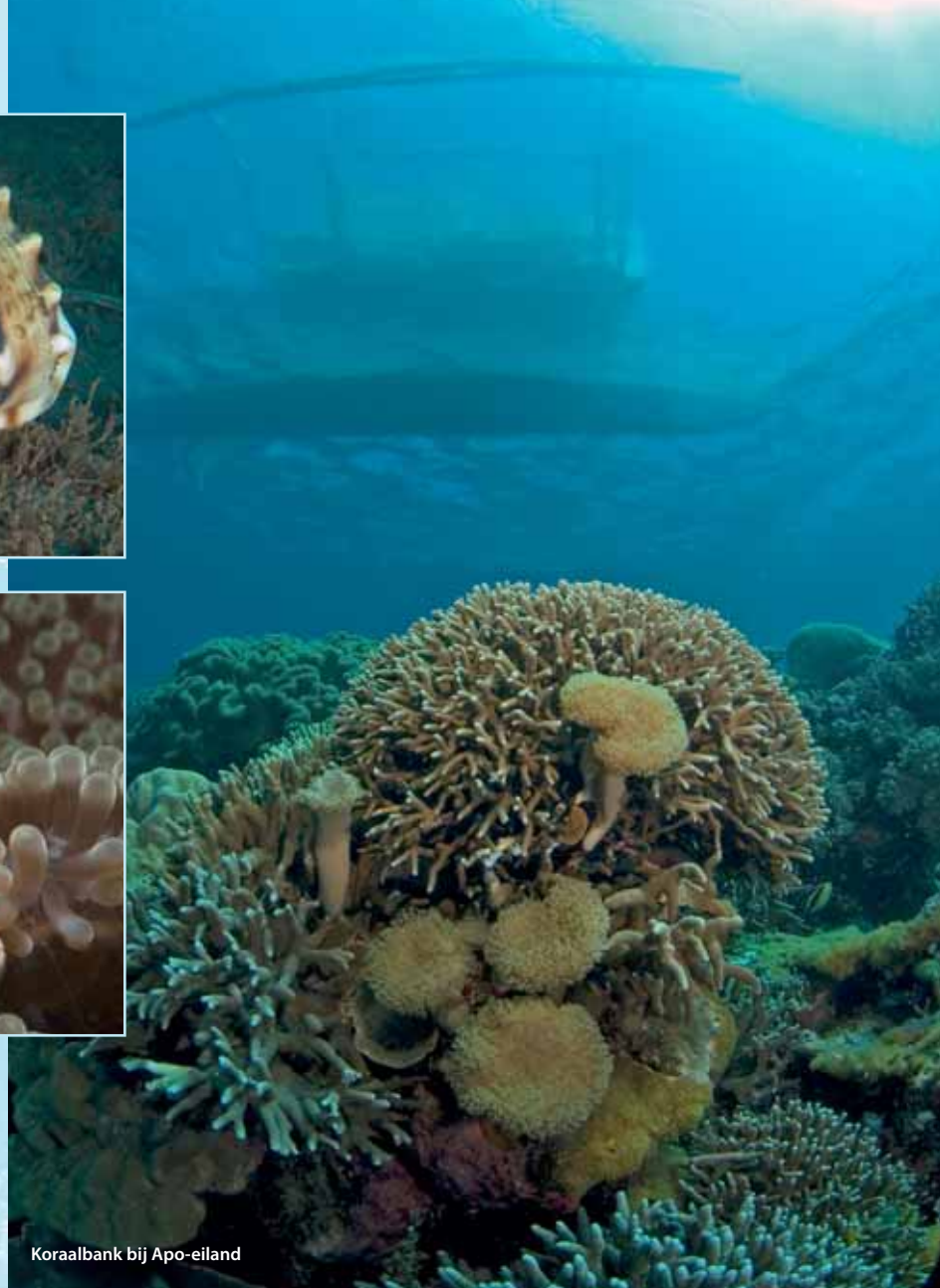
Koraalbank bij Apo-eiland

maar het is toch niet de bedoeling van deze duik. Pas als het water wat rustiger wordt en er weer kan worden rondgekeken, komt ook de buddy weer in beeld. Wat lager nog.