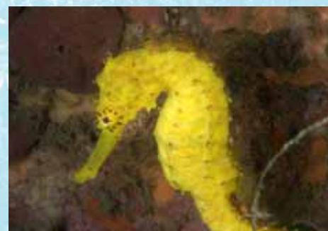
Twee fraaie zeepaardjes

volle vaart recht op een koraalblok. De buddy is weg. Het is ieder voor zich! Voor het gevoel duurt deze ongecontroleerde situatie heel lang. Het zal echter maar een paar minuten geweest zijn! Het diepste punt 32 meter, niet zo diep,