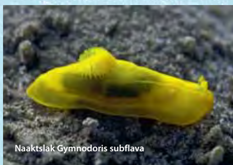
Naaktslak Gymnodoris subflava

het is maar een bijnaam. Officieel zijn het vliegende paardjes of Pegasus draconis . Ze zijn familie van de zeepaardjes, maar vallen veel minder op dan hun beroemde neefjes! Een grote verrassing was een heel klein geel slakje op het zwarte zand. Onbekend en ook niet in de boeken terug te vinden! Nagevraagd aan 'huisbioloog' Godfried van Moorsel: Gymnodoris subflava . Geen slak (seaslug), maar een echte naaktslak (nudibranch).