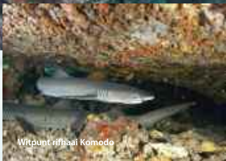
Witpunt rifhaai Komodo