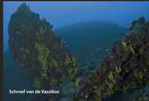
Schroef van de Vassilios