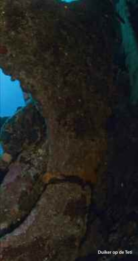
Duiker op de Teti

spanten op 10. Daar zit ook een mooie grote kokerworm, een spirograaf, heel gewoon hier! Het ruim ligt open en de lading van straatkeien, kinderhoofdjes, is duidelijk zichtbaar! Vanaf 20 meter is er bezoek te verwachten van de drie grote congers, die daar wonen. Zij zijn duidelijk aan duikers gewend. Ze komen tot dichtbij de camera, maar voor de foto blijven ze helaas niet stil zitten.