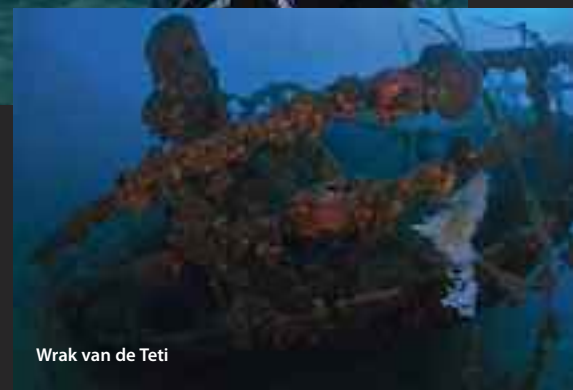
Wrak van de Teti