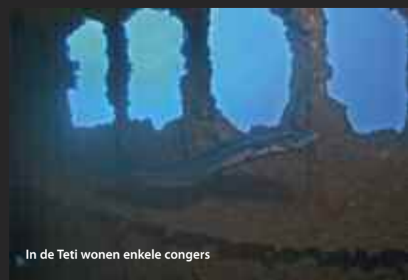
In de Teti wonen enkele congers