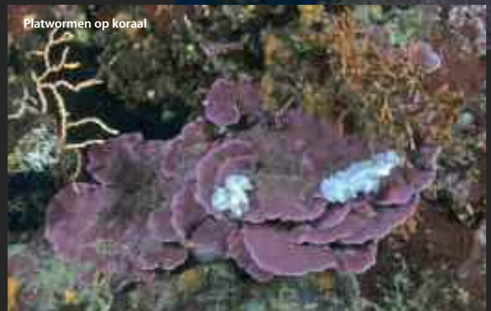
Platwormen op koraal